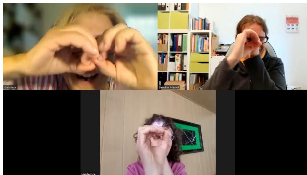
Blick in die Zukunft: Was wird am 13.06.2023 in Berlin passieren?

„Liebes Team vom Lachtelefon. Zunächst möchte ich Ihnen meinen Respekt aussprechen. Denn in diesen Tagen und auch in den letzten Jahren Gründe zu finden, um gemeinsam zu lachen, ist und war nicht einfach. Beeindruckend ist, dass Sie 2022 mehr als 12.000 Anrufe angenommen haben. Das spricht für den Bedarf. Auch Respekt dafür, dass Sie Ihre Mitarbeiteranzahl entsprechend Bedarf erhöhen konnten.“