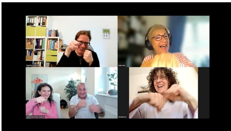
Lachboxen beim Lachyoga-Mittagstisch

In Berlin entstanden ganz neue Verbindungen: Lachyoga und türkische Folklore wurde mit großer Freude kombiniert, und sehr gute Erfahrungen mit Lachen, Boxen und Lachboxen gesammelt.