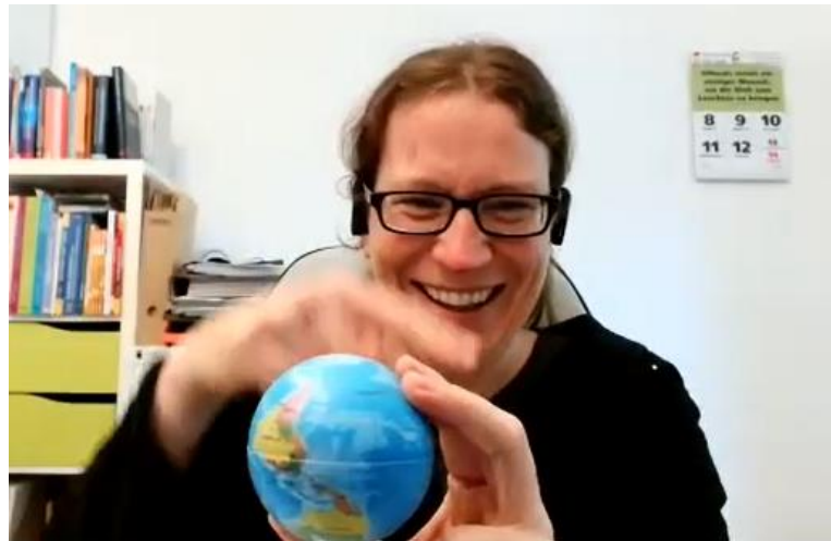
Um die Welt lachen

Auch wie wertvoll die Verbindungen sind, die zwischen Lachyogis bestehen, konnte festgestellt werden. Der Weltlachatag kann auch eine gute Initialzündung für manche sein, mit Lachyoga anzufangen – oder anzufangen, Lachyoga-Übungen anzuleiten, wie Ulrike in Leonrod.