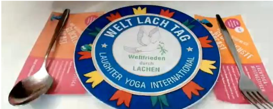
Der Lachyoga-Mittagstischsteller mit dem Weltlachtagslogo