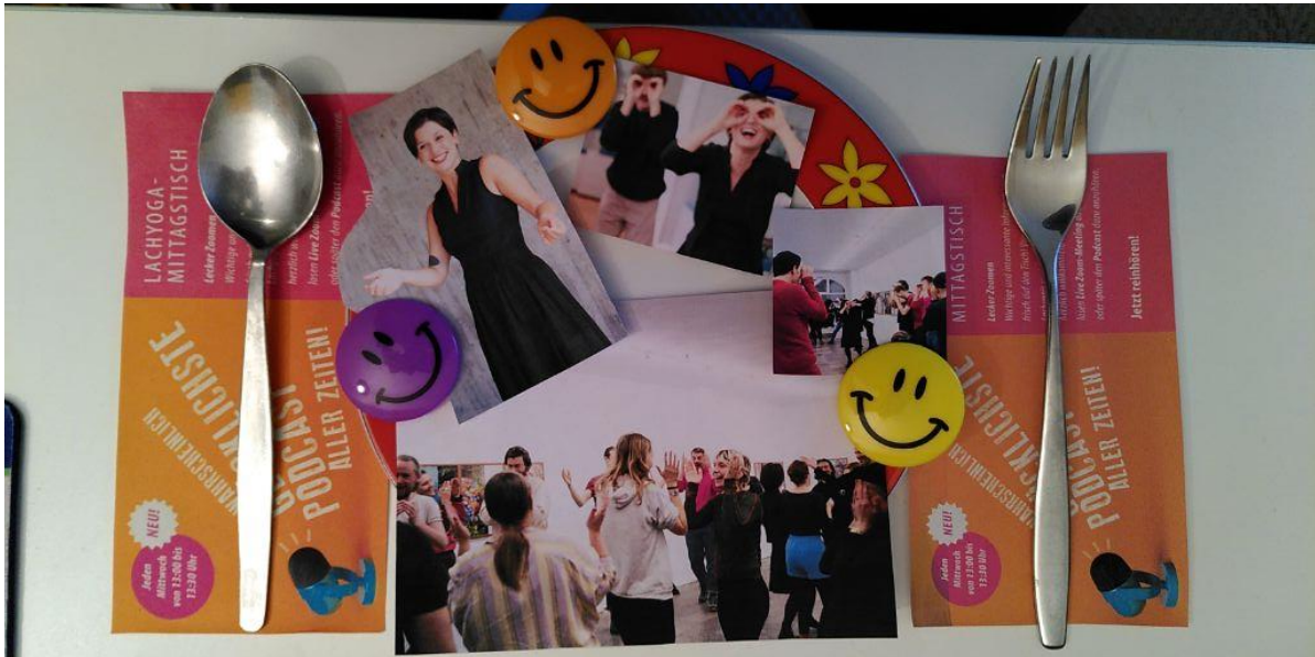
Lachyoga-Mittagstisch Teller „Happy Kunst“