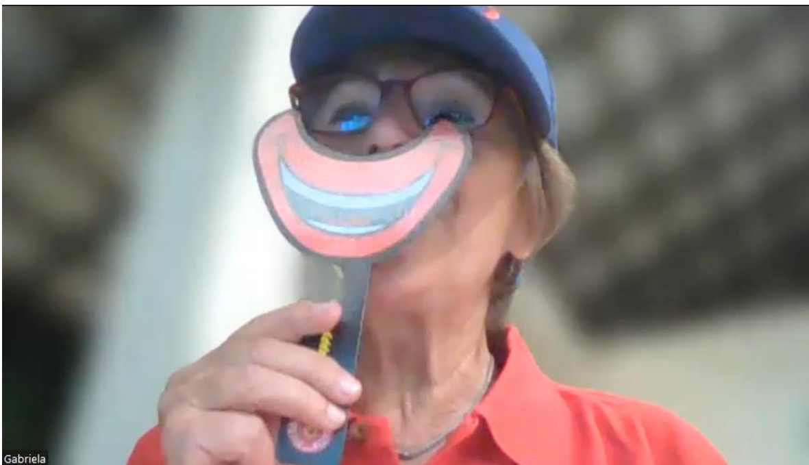
Heftchen für neu ausgebildete Lachyoga-Profis