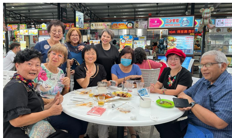
Abendessen in einem Food Court mit einigen Lachyogis aus dem Johor Bahru Happy and Joyous Club