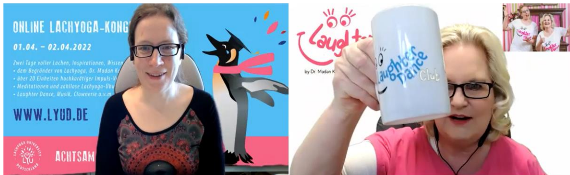
Laughter Dance Club-Tasse in Blau

Ja, für besonders engagierte Laughter Dancer gibt es wieder eine Laughter Dance Tasse. Damit der Ansporn auch für diejenigen da ist, die schon aus dem letzten Jahr eine Tasse haben, hat die Tasse diesmal andere Farben. Wer nicht bis zu den Challenges warten möchte, kann die Tänze auch ertanzen, indem er*sie 10 x beim Laughter Dance Club erscheint. :)